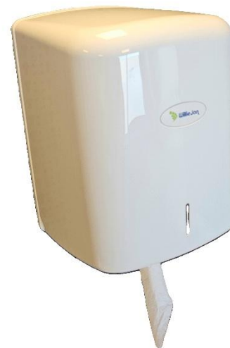
WillieJan Midi rol poetspapier houder - Wit

Het kan altijd voorkomen dat er iets niet helemaal gaat zoals gepland. We raden u aan om klachten bij ons kenbaar te maken door middel van het formulier op https://williejan.com/contact/ in te vullen of een email te sturen naar info@williejan.com